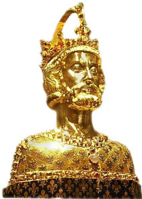
Karlsbüste aus dem Aachener Domschatz