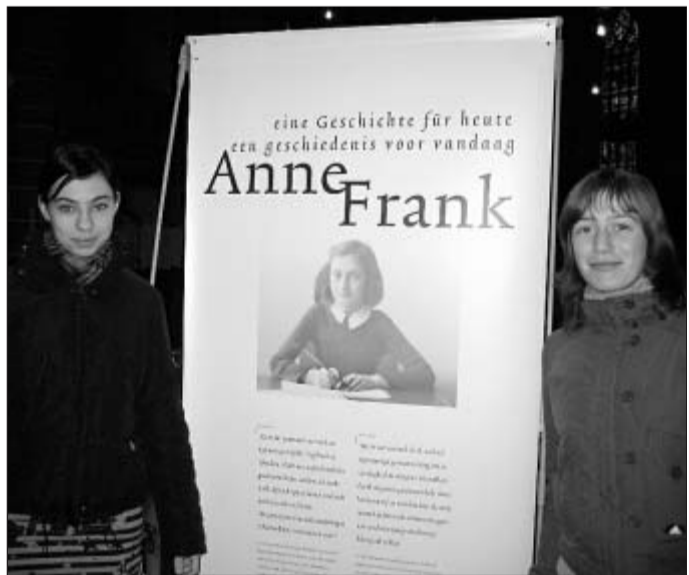
Schüler besuchten die Wanderausstellung.

Ein Unbekannter verriet alle acht Personen, sie alle wurden verhaftet und nach Auschwitz deportiert. Nur Annes Vater, Otto Frank, überlebte. Da Anne in ihrem Tagebuch schrieb, dass sie gerne Schriftstellerin werden will, veröffentlichte ihr Vater das Tagebuch seiner Tochter Anne.