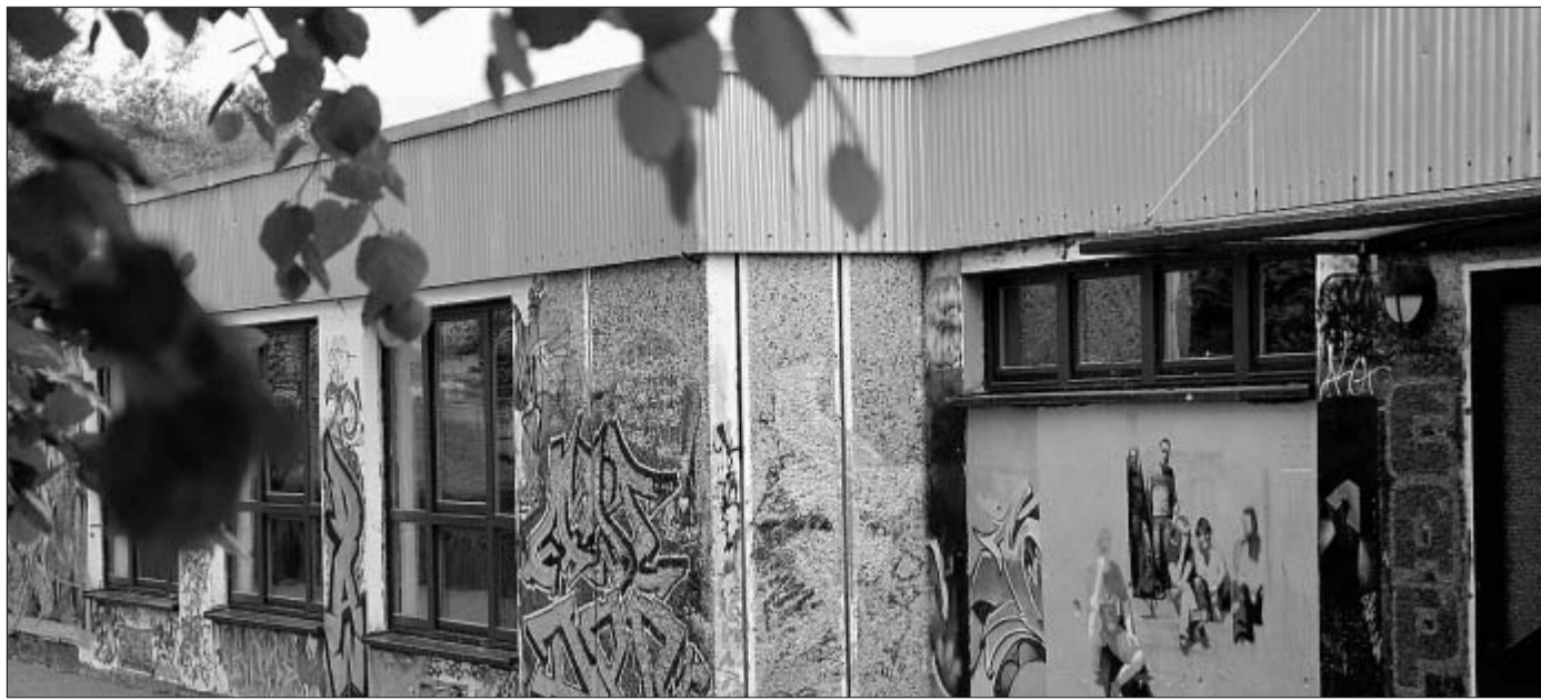
Das Landratsamt bewertet die erzieherische Arbeit im Jugendhaus Walperloh als unzureichend.