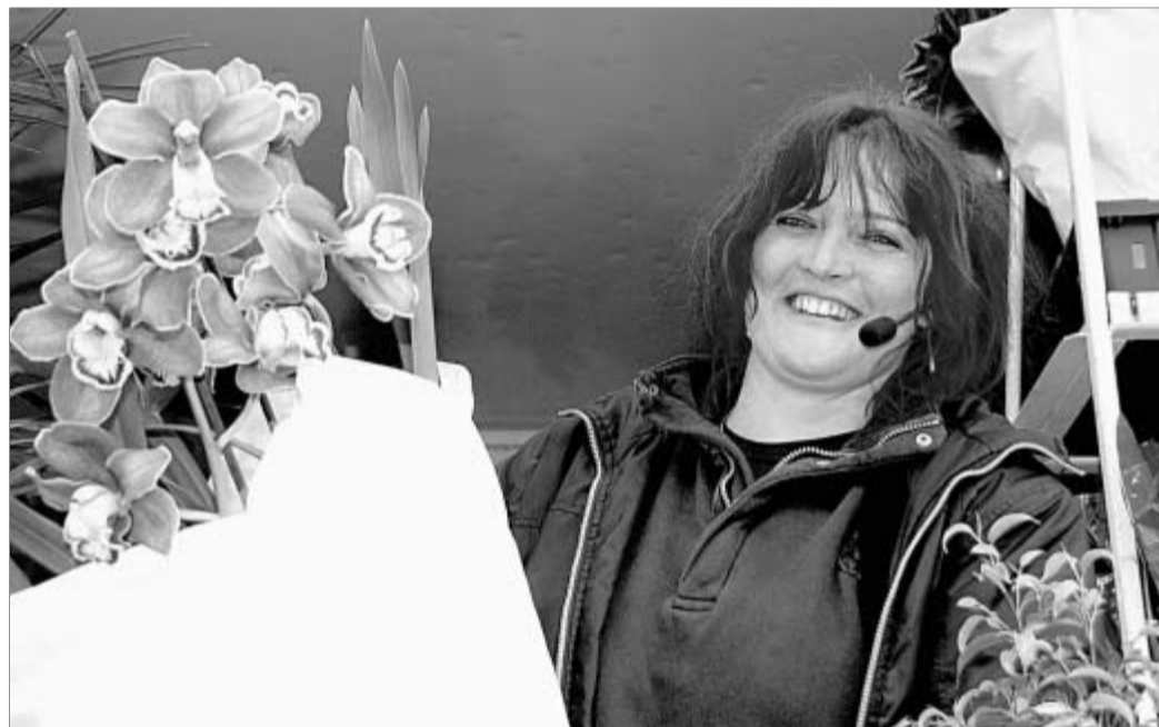
„Blümchen“ kommt seit 15 Jahren nach Schmalkalden und preist ihre Pflanzen an.

Noch bis Oktober ist Blumenkathrin auf Märkten in der ganzen Republik zu finden. Auf dass es nach der Winterpause auch in Schmalkalden wieder heißt: „Bei dem Angebot könnt Ihr nicht Nein sagen, ich kenn' Euch doch!“